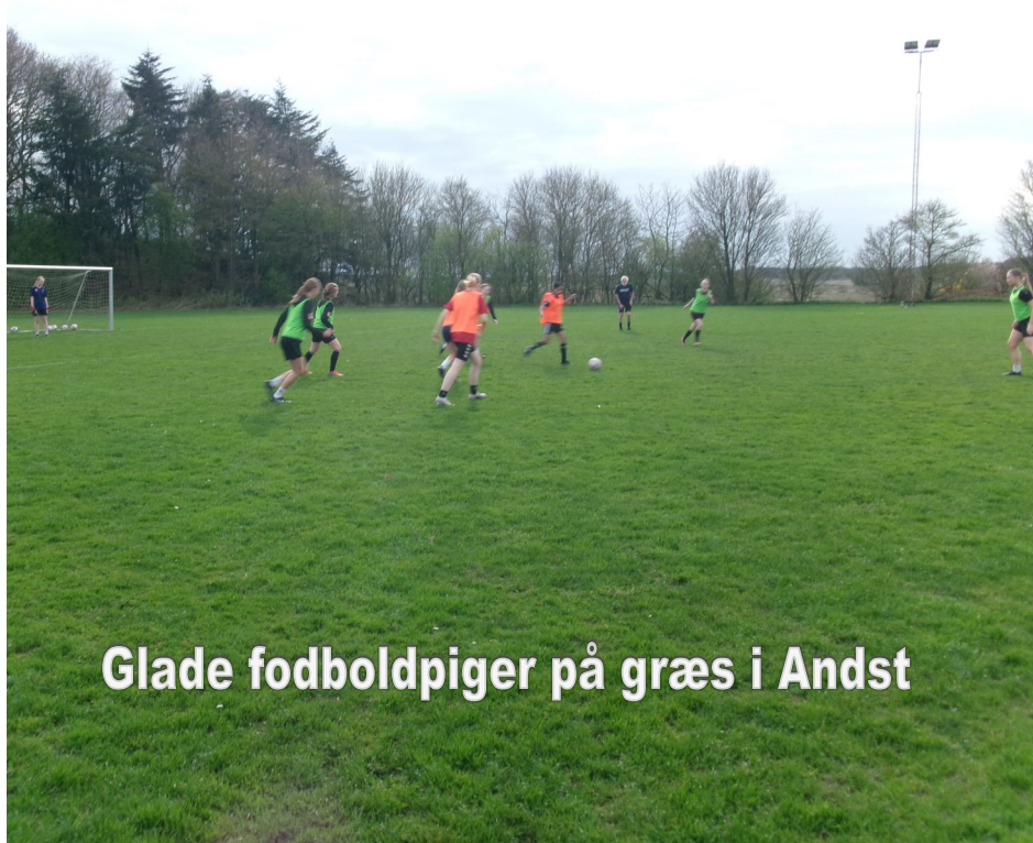
Glade fodboldpiger på græs i Andst

Spillerne har trænet på kunstgræsset i Vejen hele vinteren, men de nyder at spille på rigtigt græs, og her er banerne i Andst rigtig gode trods den megen regn.