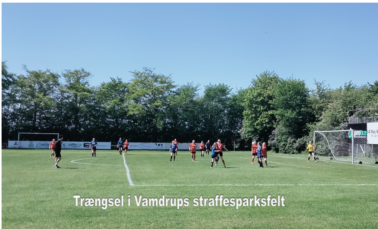
Trængsel i Vamdrups straffesparksfelt

En spændende efterårssæson, hvor U 15-piger skal spille i U 17-rækken, som kommer til at rumme U 16, U 17 og nogle U 18-spillere.