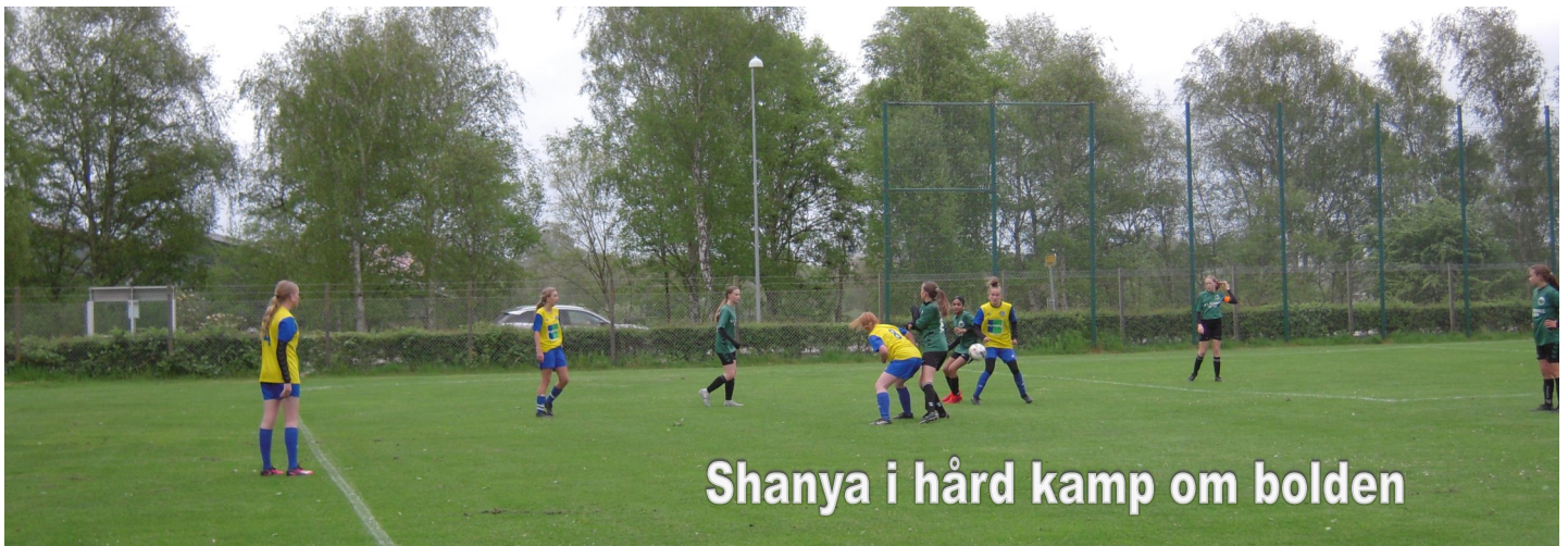
Shanya i hård kamp om bolden

Næste kamp for liga 3-holdet er på udebane mod Ribe 2. pinsedag, hvorefter vi slutter forårssæsonen af med et lokalopgør mod Team VAB.