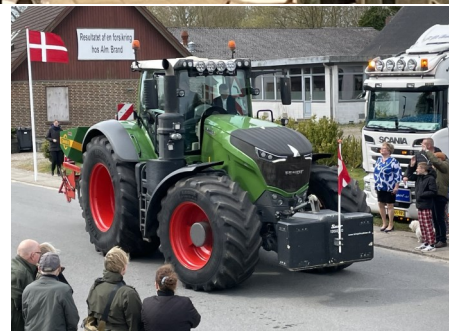
Et par glimt fra hjemkørslen.